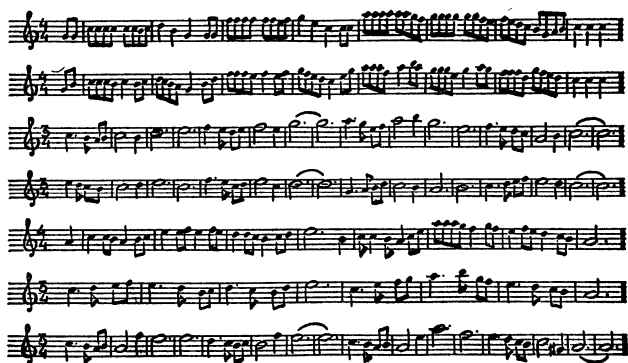
Новые мелодии, сочиненные машиной «Урал»